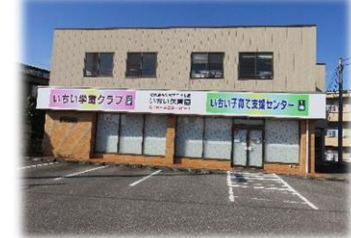
いちい子育て支援センター